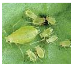
Colonie de pucerons verts

Reconnaissance : les aptères ont un corps de forme ovoïde et nu, de couleur variable, souvent verdâtre. Les ailés sont quant à eux plus élancés, avec un abdomen vert à jaunâtre. La tête et les pattes sont noires.