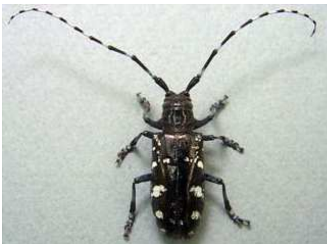
Adulte de capricorne asiatique

La femelle adulte fore des encoches dans l'écorce du tronc ou des branches pour y déposer ses œufs un à un. La larve éclot après une à deux semaines et s'alimente dans la sève en creusant profondément dans le cœur de l'arbre. Les nombreuses galeries d'1 cm de diamètres creusées par les larves entraînent une fragilité structurelle des branches et des arbres. Les larves retournent juste sous l'écorce de l'arbre pour se transformer en nymphes et passer l'hiver. Les adultes émergent de la fin du printemps jusqu'à la fin de l'été, en creusant dans l'écorce des trous de sortie.