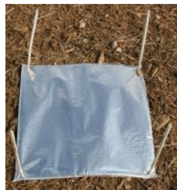
Piège à limace.

Cette observation nécessite une attention particulière. En effet, le relevé des pièges doit s'effectuer en début de matinée en conditions fraîches et humides et en «grattant» la terre sous les pièges car les limaces sont généralement abritées entre les mottes dans les premiers cm du sol.