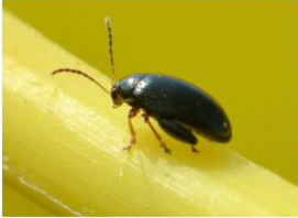
Grosse altise adulte

Il s'agit d'un gros coléoptère de 3 à 5 mm de long au corps noir et brillant avec des reflets bleus métalliques sur le dos. Les extrémités des pattes, des antennes et de la tête sont roux dorés. Elle est reconnaissable aussi par des « grosses cuisses » qui lui permettent de sauter pour se déplacer dans la parcelle.