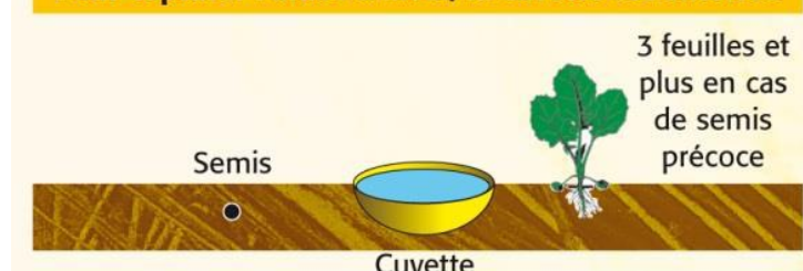
Schéma de la disposition de la cuvette jaune pour capturer l'altise d'hiver.

Pour capturer l'altise d'hiver, la cuvette est enterrée