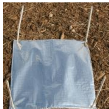
Piège à limace.

Cette observation nécessite une attention particulière. En effet, le relevé des pièges doit s'effectuer en début de matinée en conditions fraîches et humides et en «grattant» la terre sous les pièges car les limaces sont généralement abritées entre les mottes dans les premiers cm du sol.