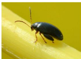
Grosse altise adulte

Il s'agit d'un gros coléoptère de 3 à 5 mm de long au corps noir et brillant avec des reflets bleus métalliques sur le dos. Les extrémités des pattes, des antennes et de la tête sont roux dorés. Elle est reconnaissable aussi par des « grosses cuisses » qui lui permettent de sauter pour se déplacer dans la parcelle.