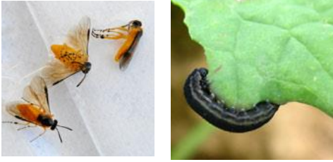
Tenthrede à l'état adulte (gauche) et larvaire (droite)

La tenthrede est un hyménoptère qui à l'état adulte mesure 7 à 8 mm, présente un corps jaune orangé, à tête noire et aux ailes membraneuses. La larve mesure 20 à 50 mm. Elle est translucide, grisâtre voire verdâtre. Elle prend un aspect noirâtre en fin de développement et devient nuisible pour la culture en dévorant les feuilles.