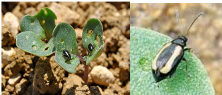
Petites altises noires du colza (gauche) et bicolore (droite). Morsures circulaires visibles

Il s'agit d'un petit coléoptère noir ou bicolore (noir, avec 1 ou 2 bandes longitudinales jaunes sur chaque élytre). Il mesure 2 à 2.5 mm.