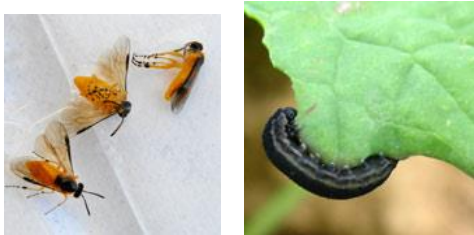
Tenthrede à l'état adulte (gauche) et larvaire (droite)

La tenthrede est un hyménoptère qui à l'état adulte mesure 7 à 8 mm, présente un corps jaune orangé, à tête noire et aux ailes membraneuses. La larve mesure 20 à 50 mm. Elle est translucide, grisâtre voire verdâtre. Elle prend un aspect noirâtre en fin de développement et devient nuisible pour la culture en dévorant les feuilles.