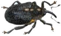
Charançon du bourgeon terminal

Le CBT adulte mesure de 2.5 à 3.7 mm. Corps brillant et noir avec une pilosité courte clairsemée. Tâches latérales blanches entre le thorax et l'abdomen. Extrémités des pattes rousses.