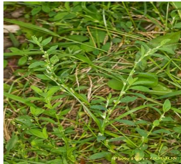
Renouée des oiseaux.

Le stade d'intervention de la lentille est dépassé pour l'ensemble des parcelles de la zone de production, néanmoins un passage de herse étrille favorise une aération de la surface du sol bénéfique à la lentille.