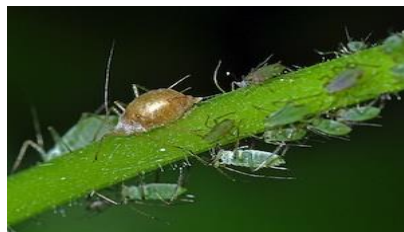
Puceron parasité par une pique de syrph

Le puceron vert mesure entre 3 et 6 mm, il prélève de la sève et provoque des dégâts directs tel l'affaiblissement du plant de lentille, avortement des boutons floraux, diminution du nombre de gousse et également il est vecteur de virus.