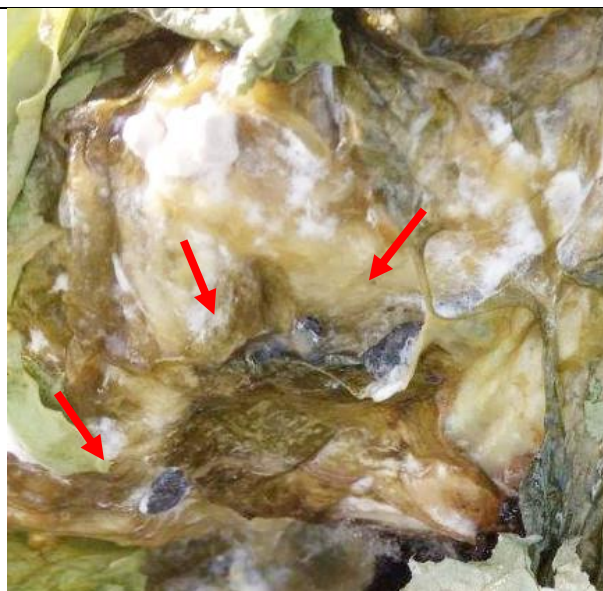
Mycélium blanchâtre et pourriture humide avec des sclérotés