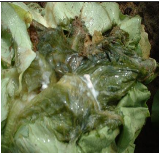
Pourritures molles