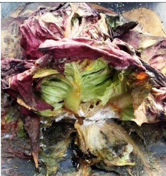
Mycélium blanchâtre à la base des feuilles au niveau du collet