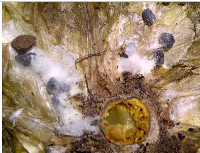
sclérotés noirs avec mycélium blanchâtre et pivot totalement pourri