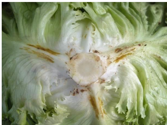
Altérations rougeâtres