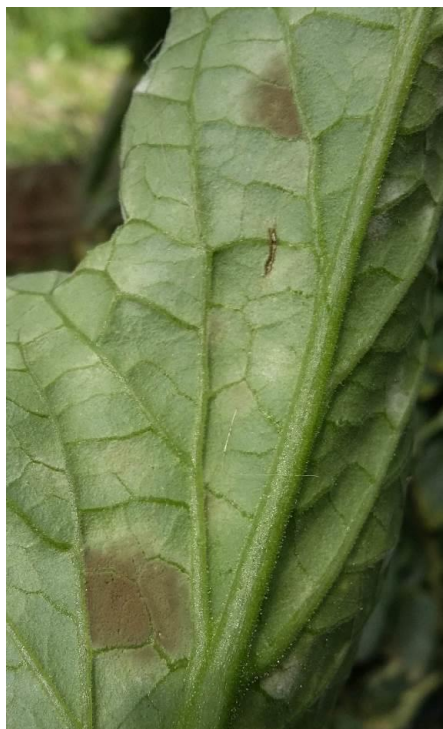
Mycovellosiella fulva :. Duvet vert olivâtre sous la feuille. Tache vert clair, assez ronde face supérieure.

Ce champignon se développe surtout en cas de fortes hygrométries. Il apparaît souvent au printemps et à l'automne. Son optimum de croissance se situe entre 20 et 25°C. Ce champignon se conserve dans le sol et débris végétaux.