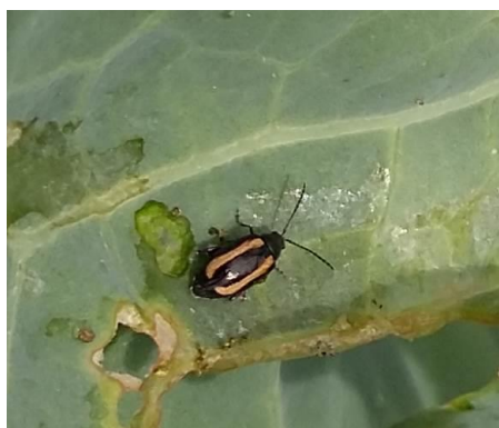
Dégâts et adulte de Phyllotreta nemorum

Les espèces P. nemorum pondent leurs oeufs à la face inférieure ou à l'aisselle des feuilles de leurs plantes hôtes, où leurs larves creusent des galeries dans le limbe des feuilles et dans les tiges. Le stade larvaire, qui dure environ quatre semaines, est suivi de la diapause des chrysalides. La nymphose a lieu dans le sol et dure 8-14 jours.