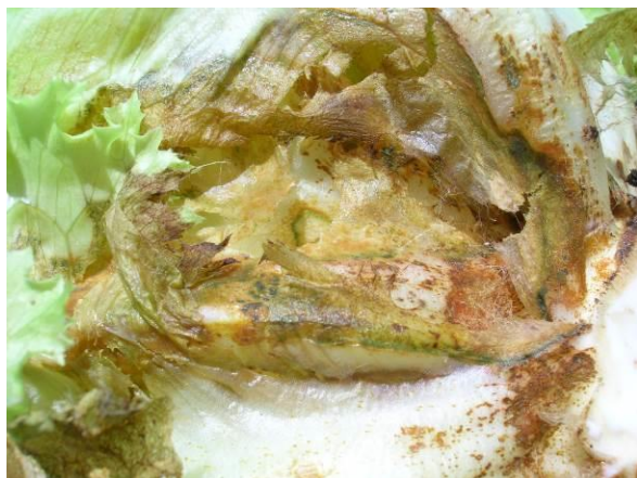
Pourriture plus ou moins humide du limbe

Ces pourritures touchent d'abord les feuilles basses qui flétrissent et jaunissent, puis gagne les feuilles du cœur.