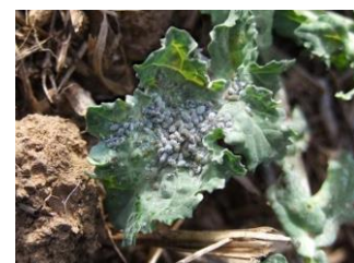
Colonie de pucerons cendrés en manchons

Biologie de l'insecte : les aptères sont de couleur jaunâtre à la mue. Une sécrétion cireuse leur confère leur aspect gris cendré. Les individus sont regroupés en colonies serrées. Ils entraînent une déformation des feuilles, des rougissements et/ou des décolorations de plante.