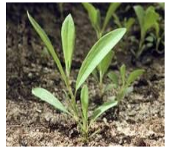
RENOUEE DES OISEAUX

Le désherbage mécanique en post semis avec la herse étrille, propose des résultats satisfaisants. Cet outil est apprécié en raison de sa capacité à intervenir dans les 3-5 jours suivant le semis, mais aussi en raison de son action sur l'ensemble de la surface du sol, y compris sur le rang.