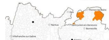
COMMUNES DES ZONES RÉGLEMENTÉES POUR DES MESURES DE GESTION DE FOYER DE LOQUE AMÉRICAINE (octobre 2024) Auvergne-Rhône-Alpes

Carte des zones réglementées définies autour des foyers de loque américaine https://draaf.auvergne-rhone-alpes.agriculture.gouv.fr/loque-americaine-mesures-de-gestion-de-foyer-et-carte-de-zones-reglementees-a3481.html