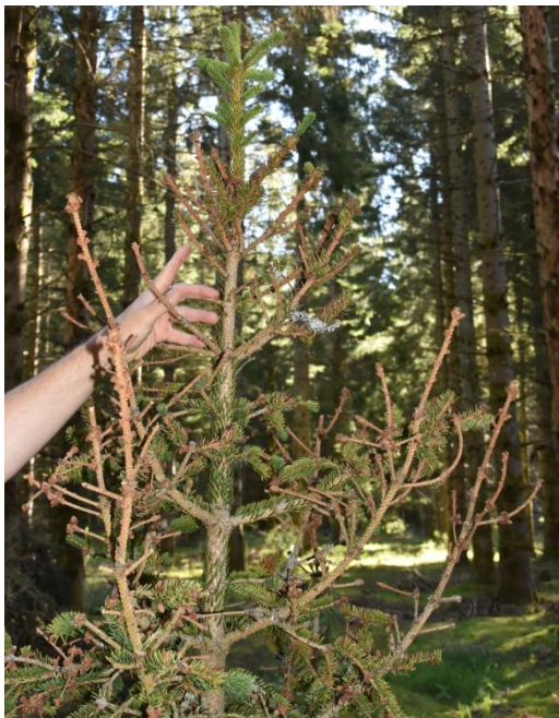
Cime dégradée mais pas sèche

Les scolytes des épicéas sont présents sur les massifs et risquent de profiter de cet affaiblissement des arbres pour se développer.