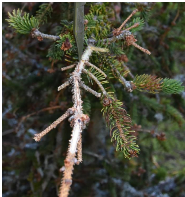
Nécroses sur rameaux

Les risques pour l'été 2020 sont donc maximum : les scolytes ont la capacité de coloniser des bois déjà très affaiblis.