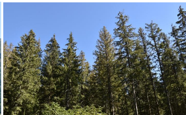
Lisière très atteinte