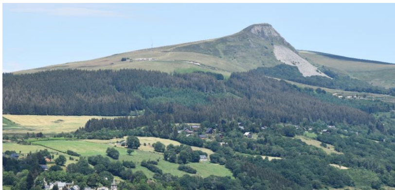
Peuplement affecté à Murat-le-Quaire (63), avec un jeune peuplement vert de sapins au milieu des épicéas affectés

Les pessières sur la zone Massif central de la région (départements 07, 42, 43, 15 et 63) sont concernées par des symptômes inquiétants quant à leur état de feuillaison. Ces peuplements restent à des altitudes qui semblent encore compatibles avec le maintien de l'épicéa dans les objectifs de gestion. Néanmoins le phénomène identifié au cours du printemps et de ce début d'été vient de s'aggraver. La plupart des peuplements visités sont affectés de façon plus ou moins intense par le phénomène.