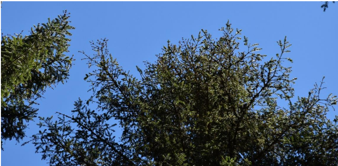
Aspect des houppiers claires avec une perte foliaire importante et des mortalités de rameaux