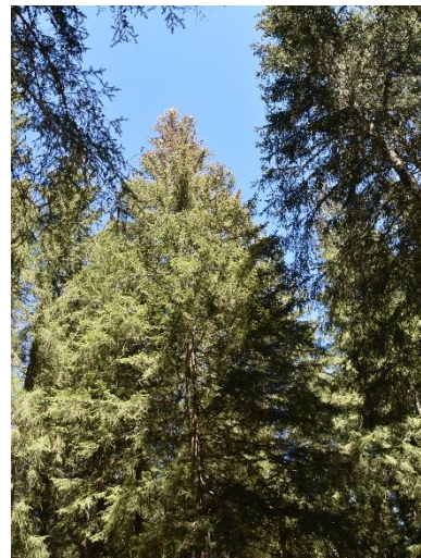
Aspect d'un houppier dégradé