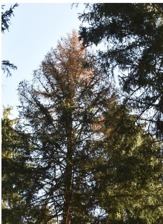
Houppier colonisé par le chalcographe

Durant cette période et jusqu'à la fin du mois de septembre, les bois issus de coupes normales, non écorcés doivent être évacués des massifs dans les 4 semaines qui suivent l'abattage. Cette mesure sanitaire a pour objectif de limiter la montée en puissance des populations de scolytes.