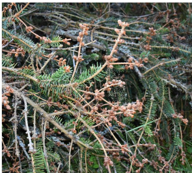
Dessèchement de rameaux sur les zones de floraison

Pour en savoir plus consultez le réseau des CO du pôle Auvergne-Rhône-Alpes.