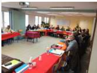
19 lycées agricoles labellisés en 2016.