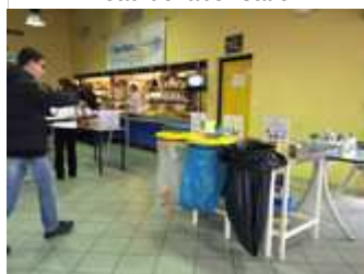
Le temps du repas a permis de découvrir le dispositif de tri des déchets mis en place par le lycée de Pressin..

15 établissements d'enseignement agricole publics et privés sur les 19 labellisés ont répondu présents à l'invitation de la Région et de la DRAAF pour une première journée d'échanges de pratiques.