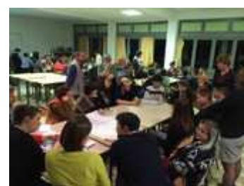
Des tables tournantes et des témoignages d'élèves sur leurs actions Un barcamp fort riche et apprécié !