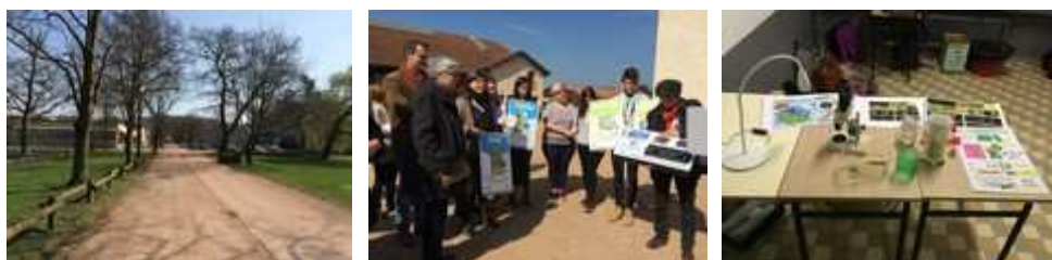
En mars à Roanne pour la rencontre des Ecovolontaires de la nouvelle région Auvergne-Rhône-Alpes : barcamp et mise en avant des projets d'élèves (ici le club Chrysoperlis du lycée de Valence), visite de la ferme et du dispositif de tri des déchets, ateliers, le tout dans une ambiance conviviale et studieuse.

Réseau national Éducation pour un Développement Durable