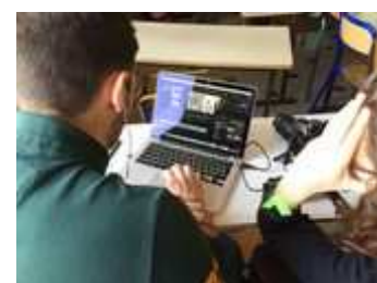
Des jeunes en action sur le thème de la communication. Ici, atelier de réalisation d'un pocket-movie.