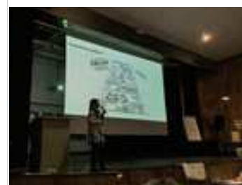
Les apports d'Orane Bischoff, de Montpellier Supagro institut de Florac, sur la mobilisation des élèves.

Les outils, ressources et les productions des ateliers seront diffusés aux établissements.