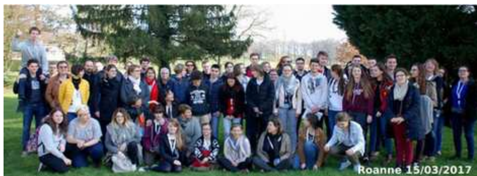
Une soixantaine de participants, jeunes volontaires et adultes, réunis à Roanne.