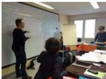
Restitution des ateliers d'échanges de pratiques par niveau de labellisation.