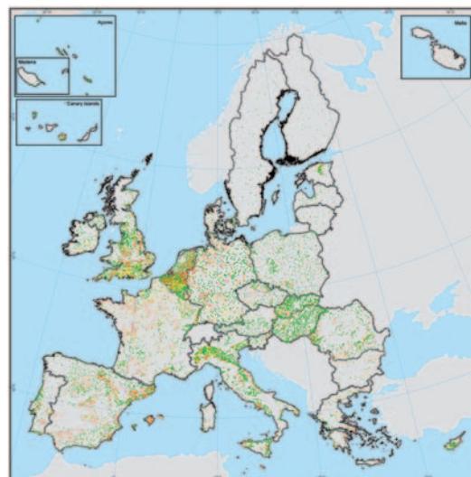
EAUX SOUTERRAINES CONCENTRATIONS MOYENNES EN NITRATES