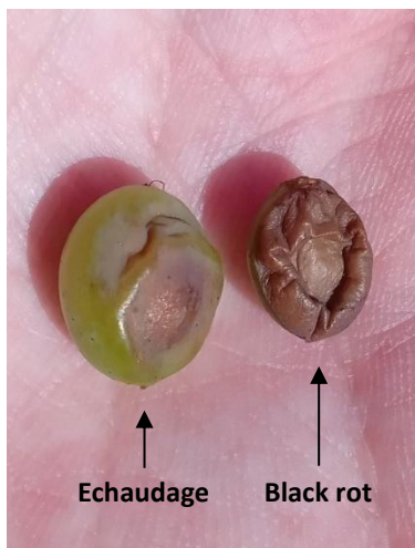
Baie échaudée (à gauche) VS baie avec black rot (à droite)