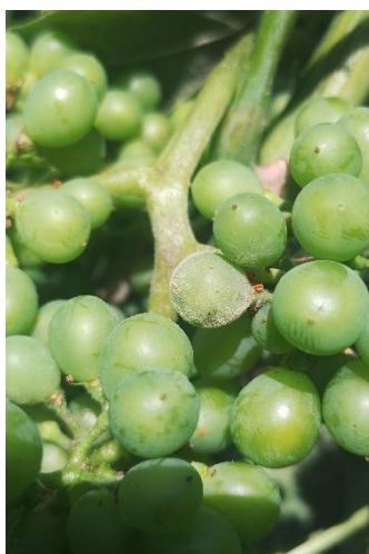
Oïdium sur baies observé en Savoie