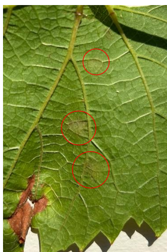
Taches d'oidium observées dans le Beaujolais