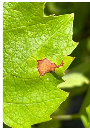
Tache de black rot observée dans le Beaujolais