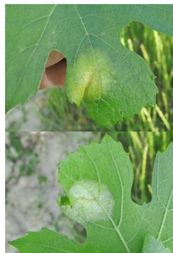
Tache de mildiou observée dans le Beaujolais (face supérieure et inférieure)