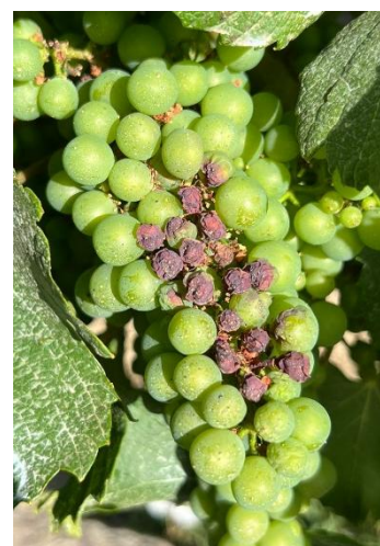
Echaudage (brûlure par le soleil) /!\ à ne pas confondre avec du mildiou