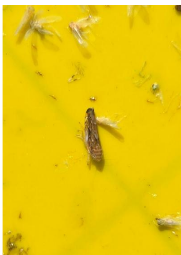
Cicadelle adulte de la flavescence dorée