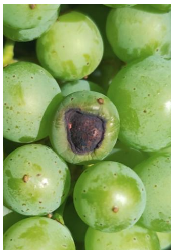
Black rot sur baie observé en Savoie