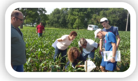
Journée des observateurs maïs